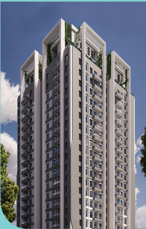
برج مسکونی نیایش - تهران / ایران