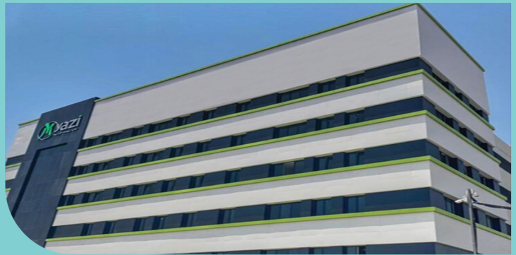
مجتمع مایازیست گلرنگ - کردان / ایران