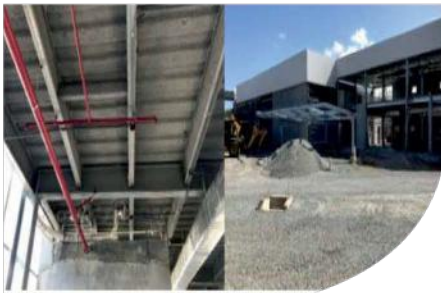
INDUSTRIAL Building - PANAMA

PROTHERM light® HAS BEEN USED IN ALL DIFFERENT TYPES OF BUILDING AROUND THE GLOBE EDILTECO REFERENCES