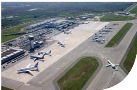
AIRPORT - BARI