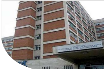
HOSPITAL - ROMANIA