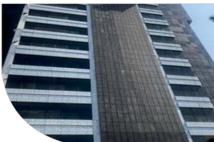
"Golrang"office Building - TEHRAN