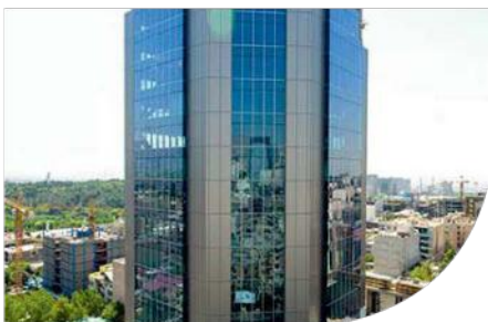
"Jahan Koudak"Insurance Building-TEHRAN