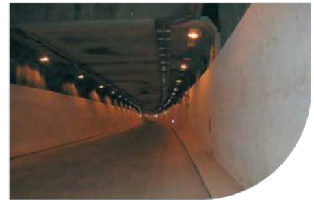
"CIRCONVALLAZIONE NORD" TUNNEL LINING - ROME