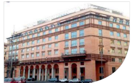
POST OFFICE - CATANIA