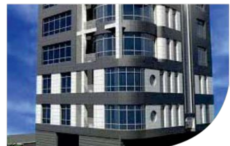
"Bahar" Shopping Center - TEHRAN